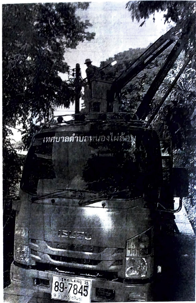
ภาพถ่ายขณะดำเนินการและดำเนินการแล้วเสร็จ