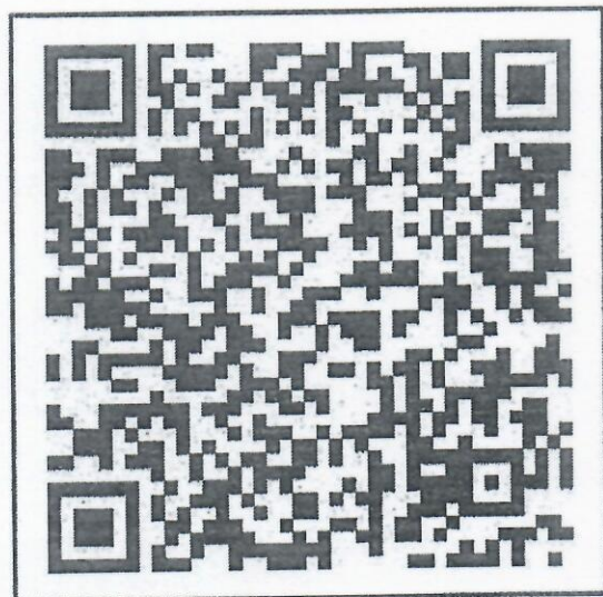
สแกน QR-Code เพื่อสมัครเข้าประกวด